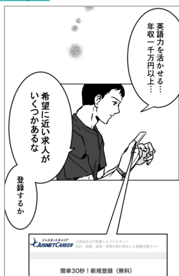
マンガ: あましま/漫画LABO