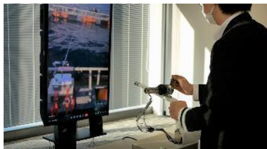
「TeleAngler」で遠隔釣りを楽しむ様子