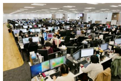
2019年スタジオ内撮影