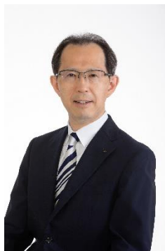
内堀雅雄 福島県知事

元テレビ朝日アナウンサー。愛知県出身。横浜国立大学卒業。1999年、テレビ朝日に入社。2016年4月より、報道番組『報道ステーション』でメインキャスターを務める。2022年3月、テレビ朝日を退社。同年4月、トヨタ自動車株式会社の所属ジャーナリストとなる。